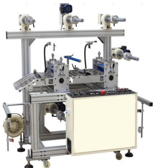
Double roll specification Multi-Laminator